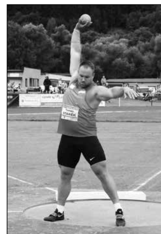
□ VRH KOULÍ byl plně v režii aktuálního mistra Evropy Tomáše Staňka.

Muži – 100 m: 1. Veleba (Dukla Praha) 10,48; 200 m: 1. Jirka (Olymp Praha) 21,00; 300 m: 1. Šorm (Dukla Praha) 32,49; 800 m: 1. Šnejdr (Slavia Praha) 1:48,56; 110 m př.: 1. Svoboda (Olymp Praha) 13,45; koule: 1. Staněk (USK Praha) 20,56; oštěp: 1. Vadlejch (Dukla Praha) 84,28. Ženy – 100 m: 1. Mihalec (Slovin.) 11,63; 300 m: 1. Horvat (Slovin.) 38,23; oštěp: 1. Špotáková (Dukla Praha) 61,45.