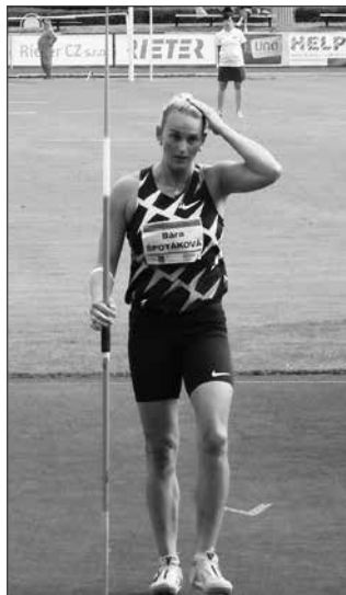
□ VÍTĚZNÁ BÁRA. Hned prvním hodem rozhodla.

Atletický mítink v Ústí ozdobil již po třetí dvojnásobná olympijská vítězka v hodu oštěpem Bára ŠPOTÁKOVÁ (40), která sem přijela i s manželem a oběma syny. Olympiáda ji zcela nevyšla, ale bylo vidět, jak má do závodění stále velkou chuť. Vyhrála